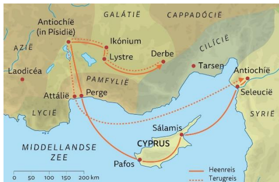
2e zendingsreis

Duidelijk staat Barnabas hier voorop. Hij heeft de leiding en Saulus volgt hem, zoals ook Johannes Markus. Ze vertrekken en varen naar het eiland Cyprus waar ze eerst Sálamis en later Pafos aandoen. Als Barnabas en Saulus gaan preken, brengen ze het Evangelie altijd eerst aan de Joden. Ze gaan altijd eerst naar de synagoge. Wanneer de Joden zich afkeren van het Evangelie, gaat Paulus naar de heidenen.