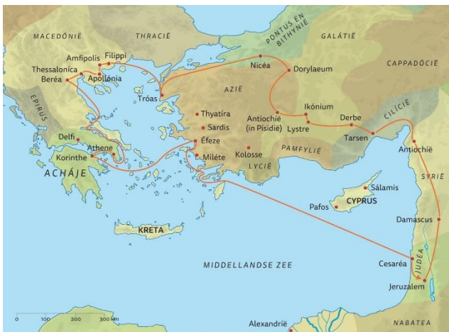
2e zendingsreis

En dan lezen we in Handelingen 16:13: En nedergezeten zijnde, spraken wij tot de vrouwen die samengekomen waren . Daar ontmoeten ze Lydia, de purperverkoopster, van de stad Thyatira (in het noorden van Azië waar Paulus en zijn metgezellen in eerste instantie naar toe wilden reizen). Als Paulus daar het Woord preekt, opent de Heere het hart van Lydia, zodat ze acht nam op hetgeen van Paulus gesproken werd (Handelingen 16 vers 14). Nadat ze gedoopt is, dwingt ze Paulus en Silas in haar huis. (Dat is: zeer dringend aanhouden, Genesis 19:3). Na dat Paulus en Silas Lydia verlaten hebben, vindt deze geschiedenis plaats.